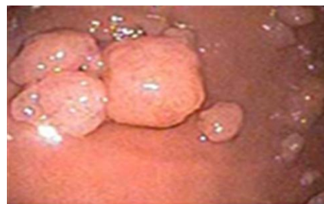
پولیپ های معده